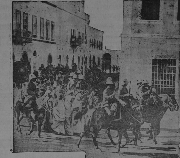
Soldados Italianos conduciendo en Trípoli una partida de árabes capturados en las oasis vecinas a la ciudad. Los árabes que resultan convictos de traición son fusilados después de brevísimo proceso verbal.