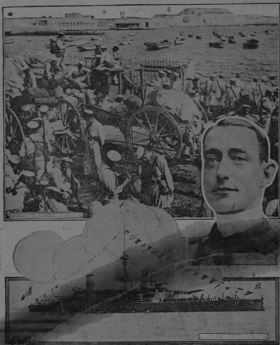
En la parte superior del grabado se ve una animada escena de desembarco de monitores para el ejército italiano en Trípoli. Al centro el Duque de Abruzzo, encargado de interceptar cualquier escorro marítimo que los turcos pretendían enviar a sus tropas en Trípoli, en la parte inferior el acorazado «Vettor Pisani» del cual es comandante el Duque de Abruzzo.